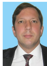
Тарас Кириченко Председатель Правления Правекс Банк