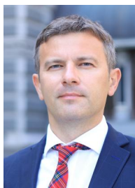
Сергій Ніколайчук Заступник Голови НБУ