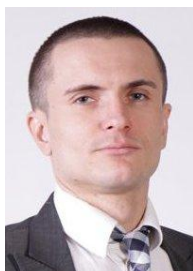
Віталій Вавришчук Екс-Директор департаменту фінансової стабільності НБУ