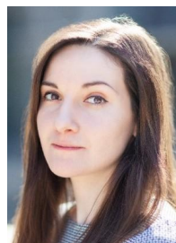
Первін Дадашова FRM Начальник управління макропру- денційної політики та досліджень НБУ