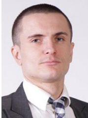
Віталій Вавришук Директор департаменту фінансової стабільності НБУ