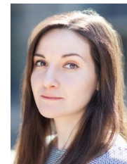
Первін Дадашова FRM, Начальник управління макропруденційної політики та досліджень НБУ